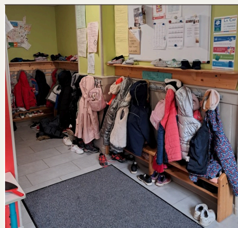
Hall (coté grands)