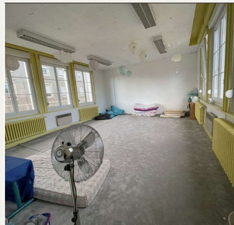
Salle de sieste

- Salle du périscolaire -> En période d'école c'est la salle d'animation pour les plus grands du périscolaire où se déroule l'accueil de ceux ci. Elle est aménagée avec des matériels adaptés aux enfants pour qu'ils soient au maximum autonome. Durant les mercredis et les accueils de loisirs, l'accueil se fait dans cette salle jusqu'à 9h que les groupes soient séparés.