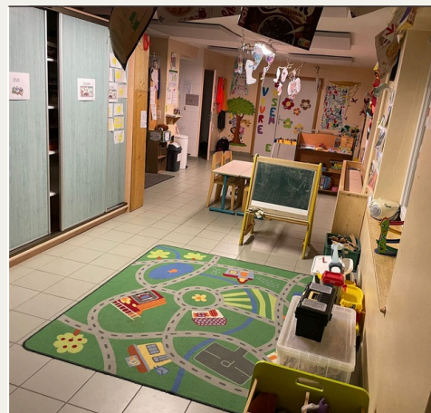
Salle des Dinos

- La salle des pompiers -> Cette salle nous est mise à disposition pour pouvoir faire les petits déjeuners et déjeuners avec le groupes des plus jeunes. Les temps de repas sont des temps privilégiés d'apprentissage de l'hygiène, de l'échange et de la diversité alimentaire. Le personnel a la charge éducative de prendre le maximum de repas avec les enfants.