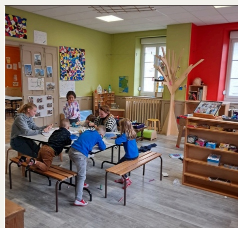
Salle du périscolaire