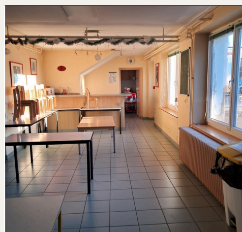
Salle des pompiers