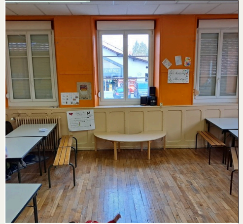
Salle du petit déjeuner

Cette salle sert lors d'activité car nous pouvons la modeler en fonction de nos besoins ( tables et bancs qui peuvent bouger)