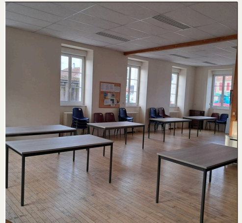
Salle du 3ème âge