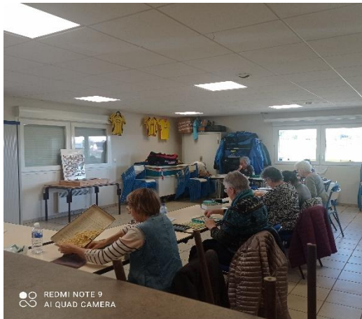
Quelques joueurs concentrés !